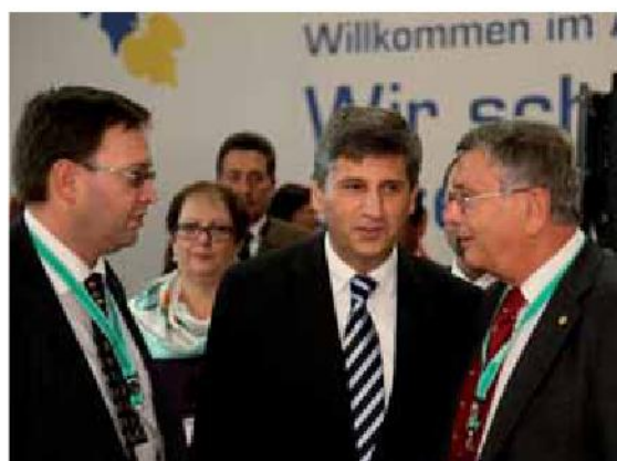
Außenminister Spindelegger im Gespräch mit Christian Rupp, Digitales Österreich, und Robert Hink, Gemeindebund.

Mit dem neuen Routenplaner „SCOTTY“ in HELPg.v.at können BürgerInnen und Unternehmen einfach und schnell die optimale öffentliche Verkehrsanbindung zu den nächstgelegenen Servicestellen von Bund, Ländern und Gemeinden ermitteln. Denn „SCOTTY“ greift auf Fahrpläne